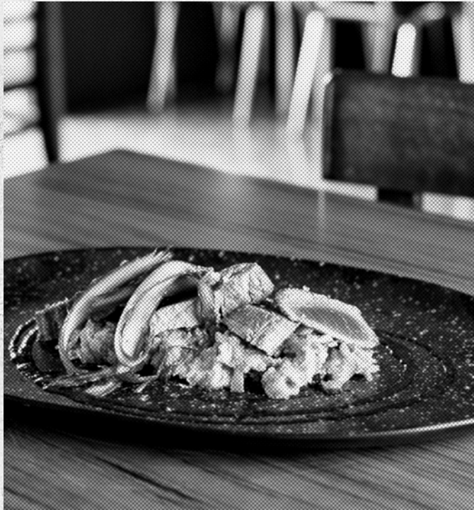
Tataki de atún