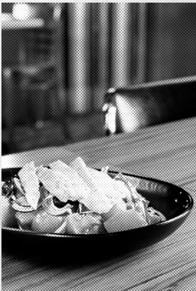
Tomàquet, ventresca i olives