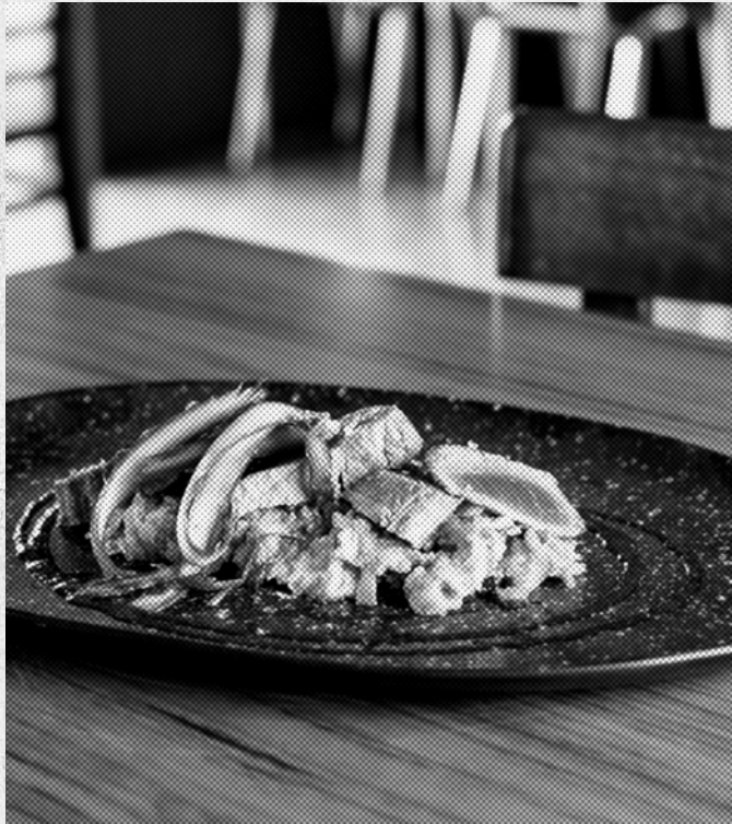
Tataki de tonyina